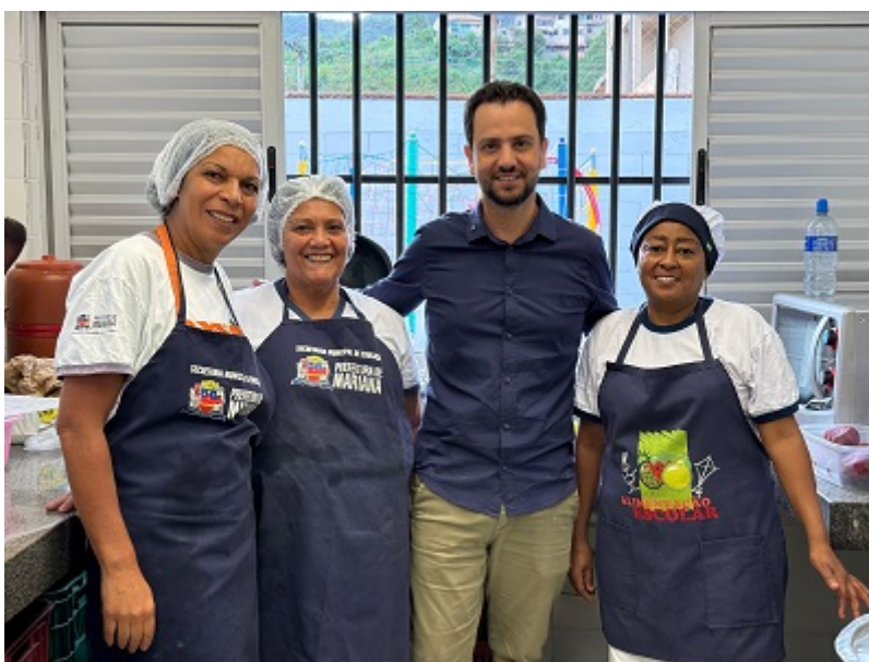
Servidoras capacitadas para atender a demanda de alimentação da unidade