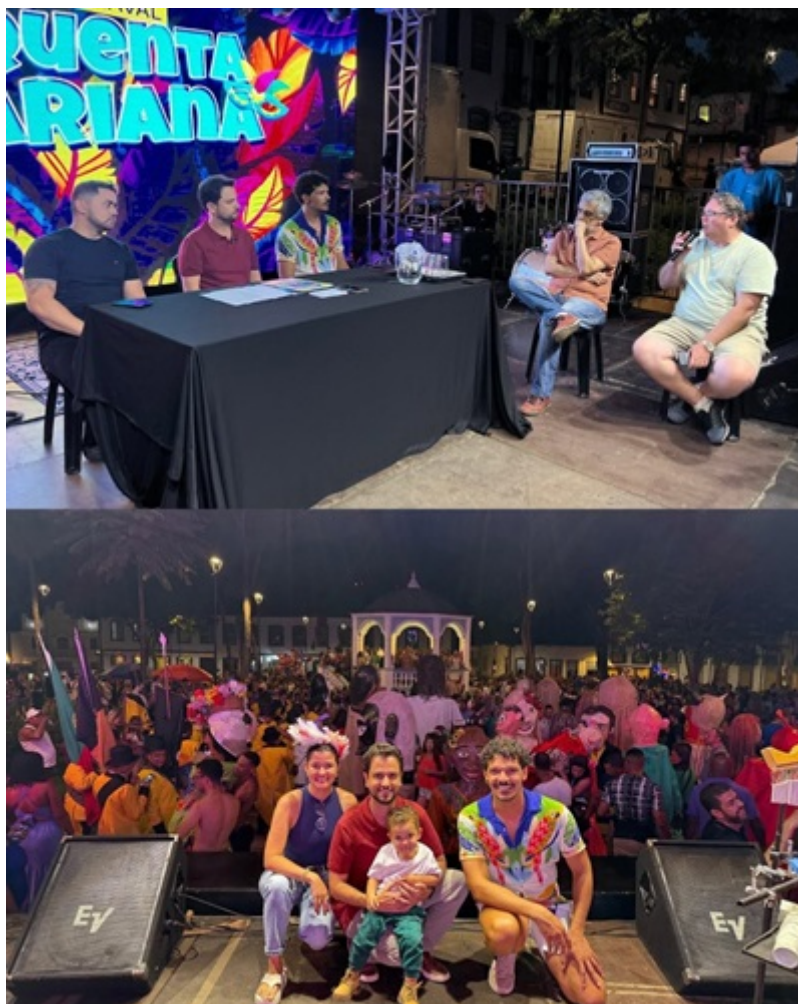
Coletiva de imprensa