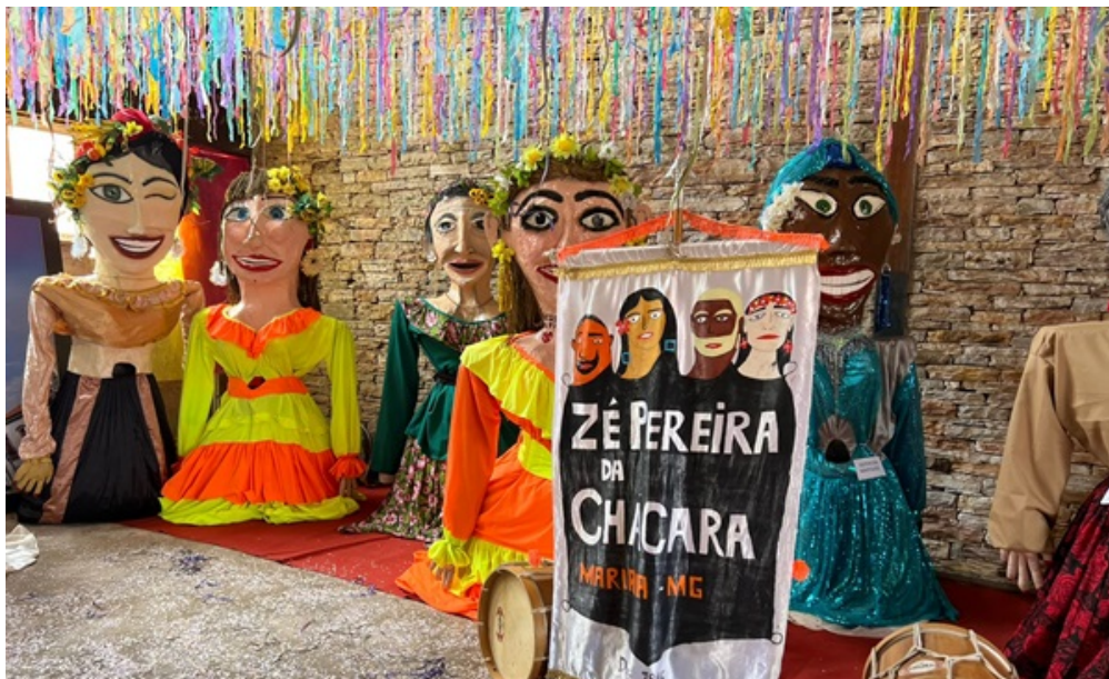
Exposição "Gigantes da Folia",