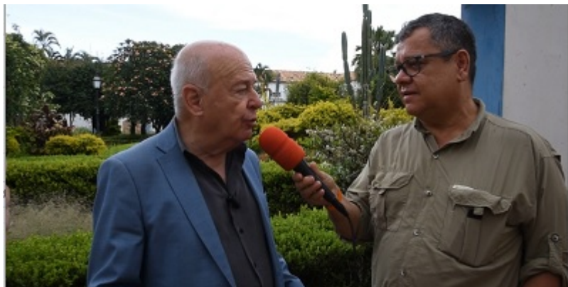
Prefeito Ângelo Oswaldo