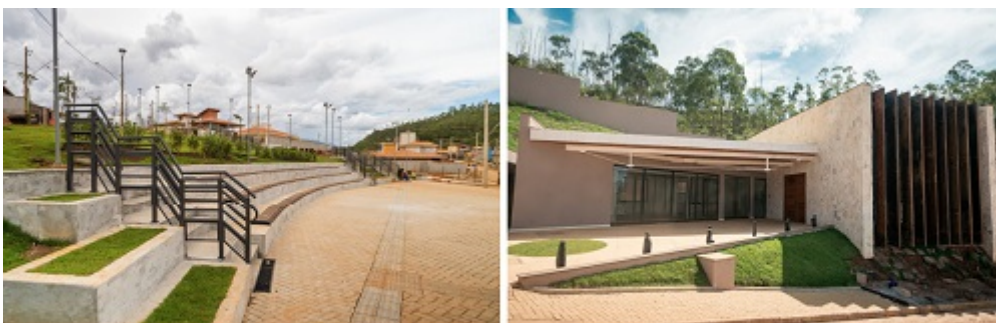
Obras da praça de São Bento e do templo da Assembleia de Deus foram concluídas em dezembro de 2022.